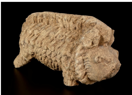
Statuette de sanglier

II e siècle ap. J.-C. / inv. 9930422