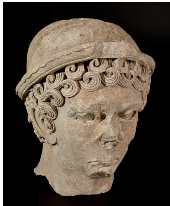
Tête de Mercure

I er siècle ap. J.-C. / inv. 9911627