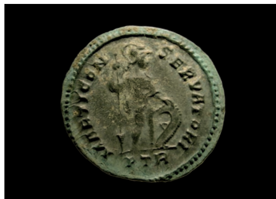
Monnaie (revers avec le dieu Mars)

I er - II e siècles ap. J.-C. / inv.9851214